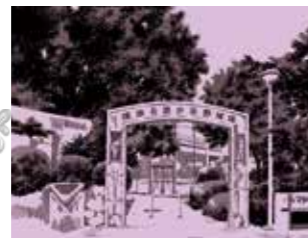
下町人情キラキラ橋商店街 Map-P.77

イベントも盛んで、区内有数の活気あふれる商店街。安くて良いもの、美味しいもの揃っています！