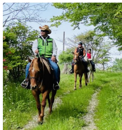
△乗馬体験(イメージ) ※実際の乗馬はスタッフが手綱を引いて歩きます