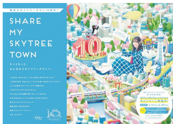
△東京スカイツリータウン10周年 キービジュアル（春）