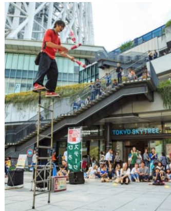
△ソラマチ大道芸フェスティバル (過去の様子)

※開催時間など、詳細は決定次第、東京ソラマチ公式HPにてお知らせします。 ( https://www.tokyo-solamachi.jp/ )