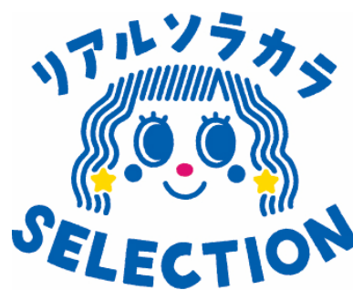
△リアルソラカラSELECTION ロゴ

第一弾のテーマは「ファミリーでおでかけ」。アウトドアにピッタリな洋服やグッズ、GWに家族でおでかけしたくなるスポットなどを紹介します。