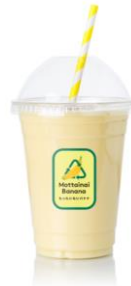
△「もったいないバナナ」を使用したバナナジュース(イメージ)