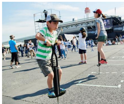
△イベントイメージ