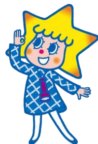
△(左) ソラカラちゃんライティング (右) 東京スカイツリー公式キャラクター ソラカラちゃん