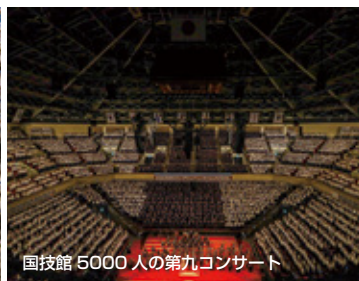
国技館 5000 人の第九コンサート