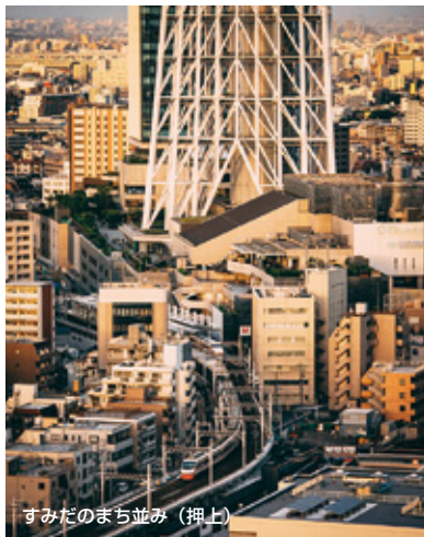
すみだのまち並み (押上)