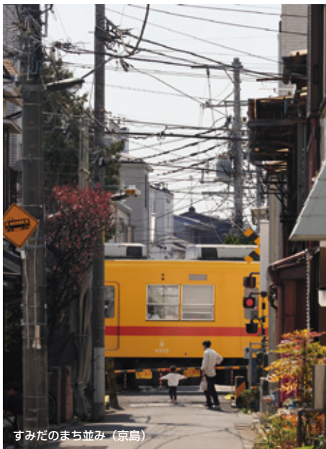
すみだのまち並み (京島)