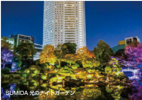
SUMIDA 光のナイトガーデン