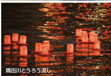
隅田川とうろう流し