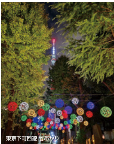
東京下町回遊 竹あかり

魅力あふれる、ロケーションスポットを厳選しました。 日常の風景に宿る個性や物語が、映像にリアリティと奥行きをもたらします。