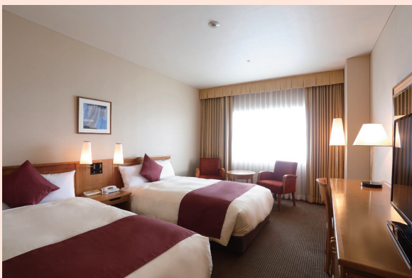
プレミアムルーム

※1泊2食付きプランのお客様には、チェックイン時にカフェ&ダイニング「アゼリア」のウェルカムドリンク または 夕食時に日本料理「さくら」でご利用いただけるワンドリンク券付き。夕食は、日本料理「さくら」にて週末プラン限定特別御膳をご用意いたします。