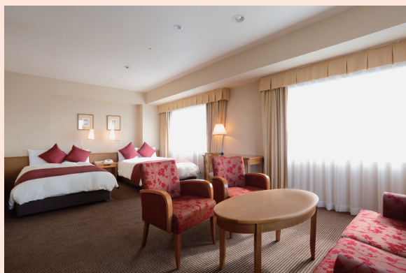
スカイツリービュー・プレミアムルーム